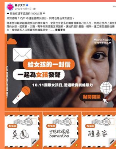
品牌貼文@親子FB | 世界展望會