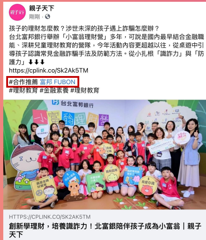
親子天下FB 品牌貼文示意

可由系統自動抓取廣告目的地的標題 或是由客戶另外提供欲露出之文案 (限26字，一行13字不刻意換行)