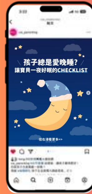
資訊圖卡@親子IG | 瑞穗鮮乳