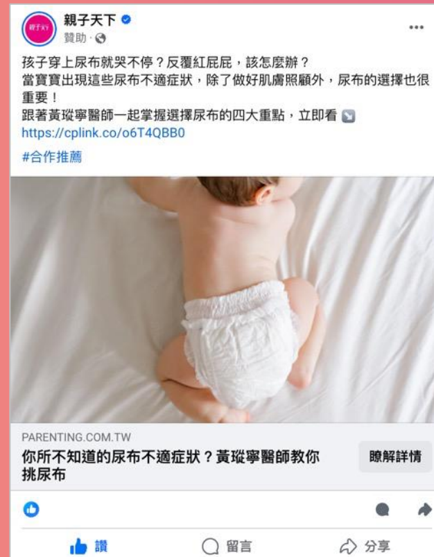
親子天下FB Dark Post貼文

③ 標題 | 可由系統自動抓取廣告目的地的標題 或是由客戶另外提供欲露出之文案 (限26字，一行13字不刻意換行)