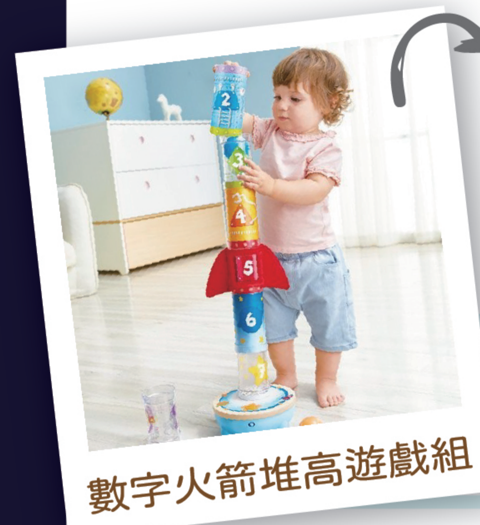
數字火箭堆高遊戲組

孩子可以依照數字順序將管子堆疊在一起，然後將球放到底座中，打開風扇開關，可觀看球體上升和下沉，讓孩子在玩樂中學習與實驗，了解空氣動力的原理。